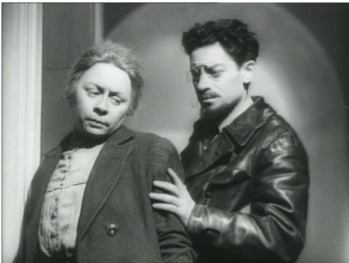
Figuras 6 e 7: Krupskaya e Trotsky; e Lenin e Stalin