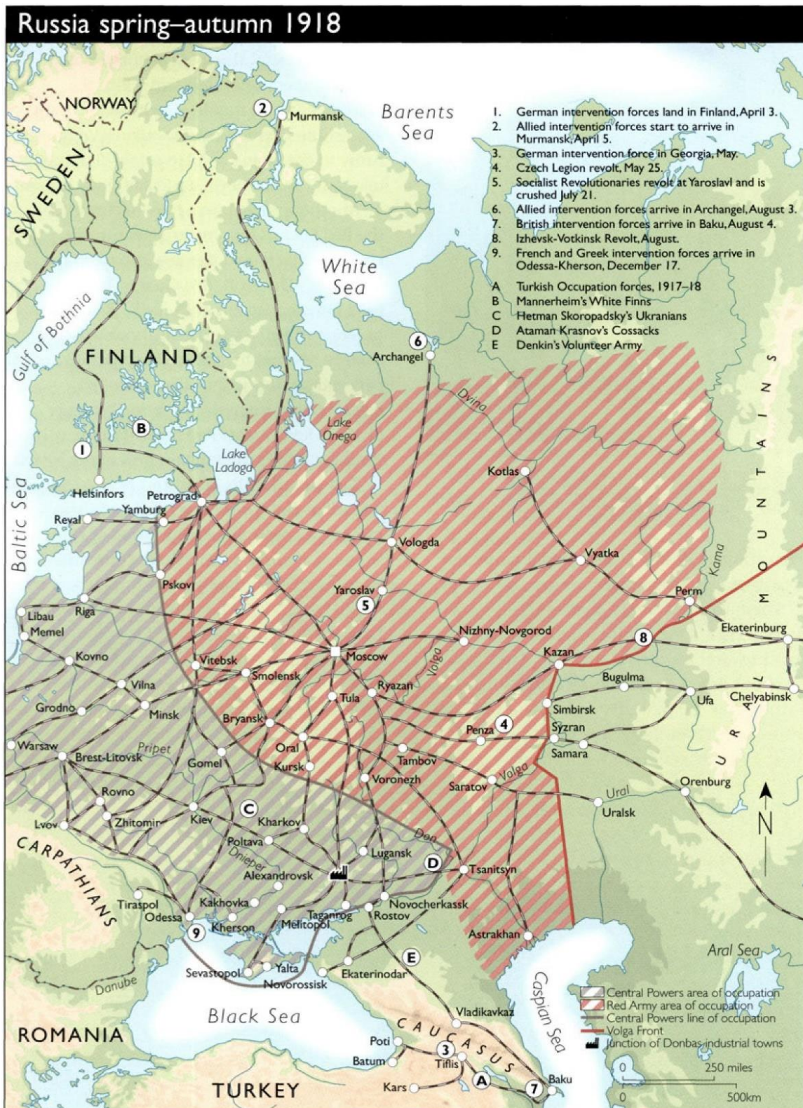
Figura 3: Os diferentes fronts durante a Guerra Civil Russa no momento de maior pressão sobre os bolcheviques.