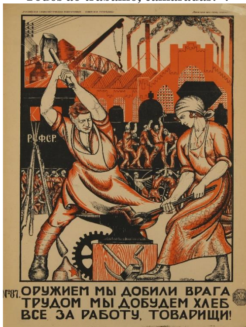
Figura 2: “Nós destruímos o nosso inimigo com armas, vamos fazer o pão com o trabalho - Todos ao trabalho, camaradas!”.

Fonte: Nikolai Kogout, 1920. Disponível em: Granger Collection/Alinari Archives Acesso em 18/02/2016