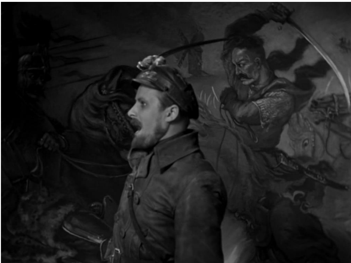
Figuras 8 e 9: Shchors como Taras Bulba. Oficiais poloneses como husarskie anioly, os hussardos alados poloneses dos séculos XVI e XVII.