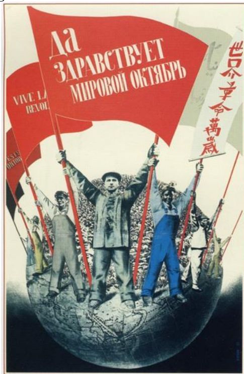
Figura 3: “Viva ao Outubro Internacional!”.

Fonte: Gustav Klutsis, 1933. Disponível em: http://www.alamy.com/stock-photo-long-live-world-october!-1933-artist-klutsis-gustav-1895-1938-60422642.htm . Acesso em 20/07/2016