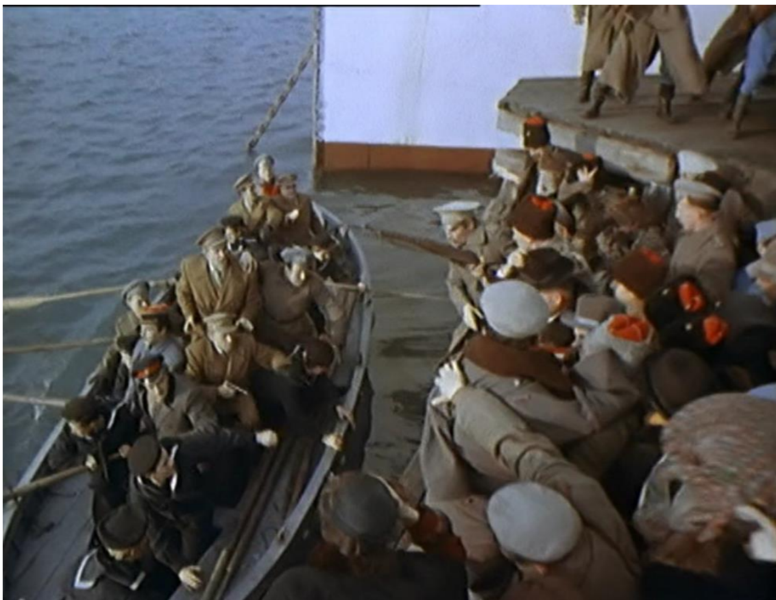
Fonte: GERASIMOV, Sergei. Tikhiy Don (330 minutos). Gorki film: 1957.