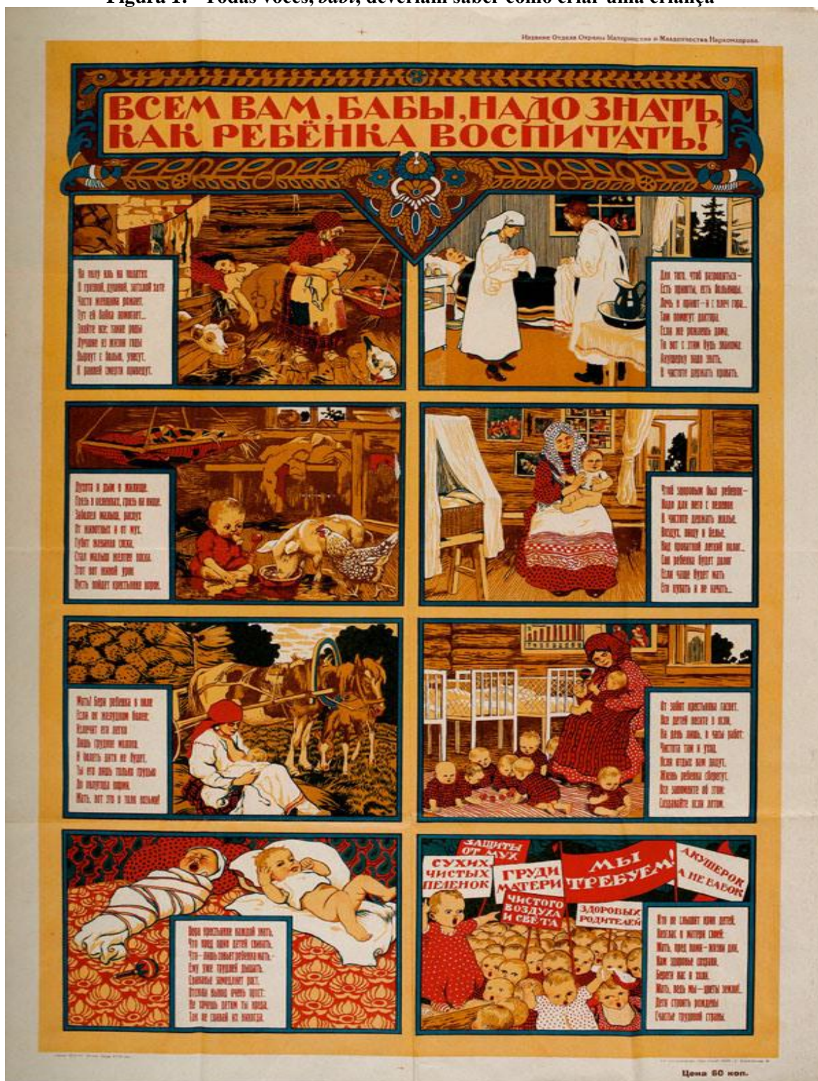
Figura 1: “Todas vocês, babi , deveriam saber como criar uma criança”