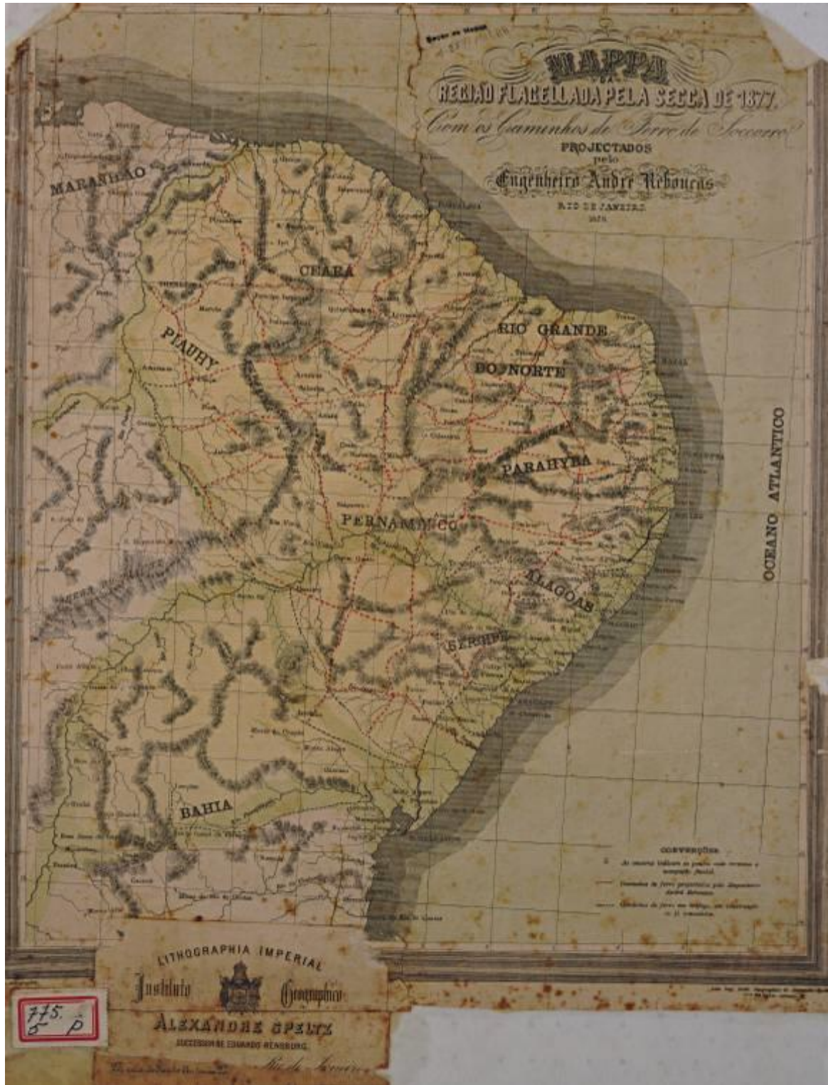
Figura 02. “Mapa da região flagellada pela seca de 1877”, pelo engenheiro André Rebouças, de 1878. O produto cartográfico apresentado associava, a exceção do Maranhão, a atual delimitação do Nordeste a uma de suas principais características, as irregularidades pluviométricas, além do projeto de ação via ferrovias.