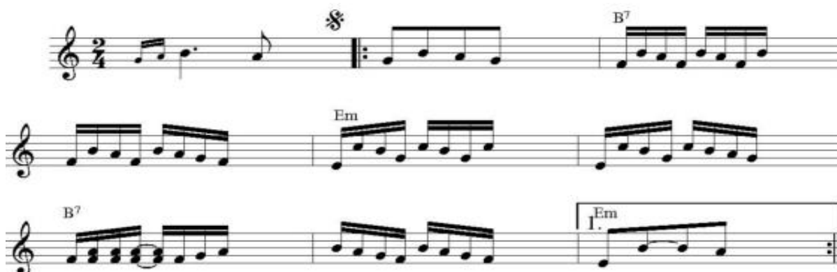
Figura 3. Trecho melódico característico da milonga arrabalera .