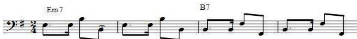
Figura 4. Trecho de condução rítmica característica da milonga arrabalera .

O próximo exemplo (figura 4) demonstra a base rítmica de acompanhamento da milonga. Esta possui um grupo rítmico formado pelas figuras musicais colcheia pontuada + semicolcheia + colcheia + colcheia que são trabalhados normalmente pelos instrumentos de percussão, juntamente com o contrabaixo e violão. Este exemplo apresenta uma linha de baixo característica, mostra a progressão i-V e tem a construção melódica de acompanhamento com base nas fundamentais e quintos graus dos acordes, no caso de mi menor (Em7) o contrabaixo interpreta a nota mi e a nota si em oitavas diferentes, porém quando a harmonia está no acorde de Si maior com sétima menor (B7), o baixo atua nas notas si (B) e fá sustenido (F#), em ambos os acordes o ritmo permanece constante com as figuras rítmicas características conforme exemplo (figura 4).