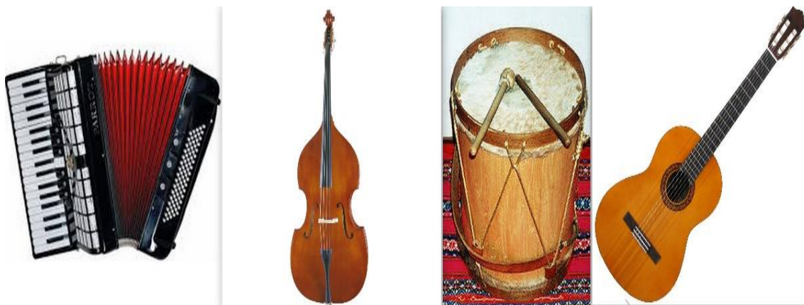
Figura 2. Instrumentos utilizados nas formações tradicionais e atuais da milonga.

desde as novas formas de tratamento de progressões de acordes, muitos deles típicos do ambiente bossanovista, uso comum de sonoridades instáveis. Sons que originalmente são formados a partir tensões e intervalos sobrepostos de segunda, quarta e sexta, além afinações para além do convencional.